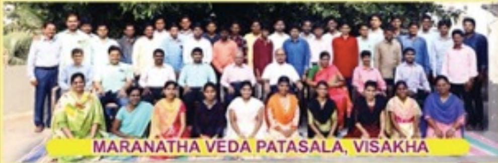
MARANATHA VEDA PATASALA, VISAKHA

వాళ్ళకర్చేది పొందడానికి గలవారు అప్లికేషన్ ద్వారా రూ. 100/-లు పంపి, పొంది, ఫూర్తి చేసి వెంటనే పంపించవలెను. భోజనము, వసతి : ఉచితము; బోధనా భాష : తెలుగు.