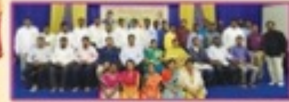
MTS Alumni - 2018